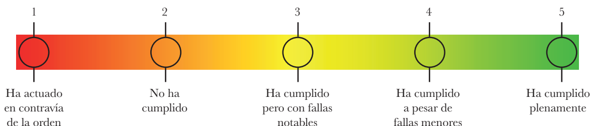
Escala de conformidad

En el caso de las órdenes que contienen varias directivas, se proporciona una puntuación y un análisis diferentes para cada directiva.